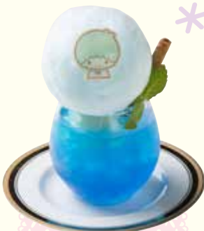
キキのふわふわ クリームソーダ ¥780(税抜)