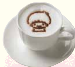
キキのカフェラテ ¥680(税抜)