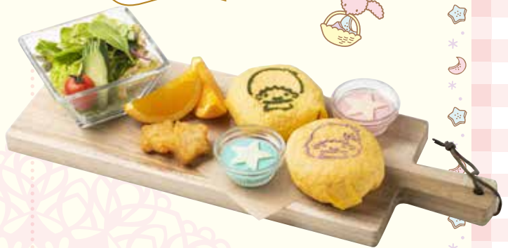
キキとララのオムライス