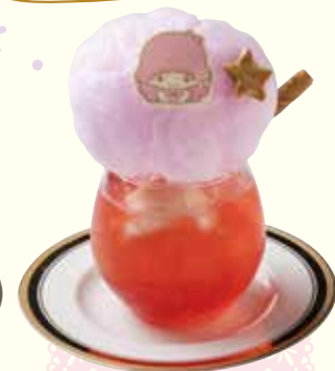
ララのふわふわ クリームソーダ ¥780(税抜)