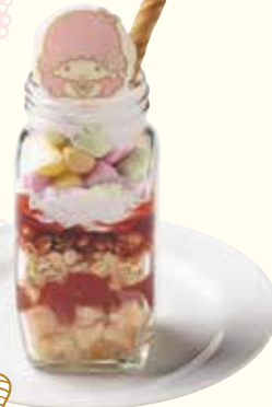
ララの ジャーパフェ ¥780(税抜)