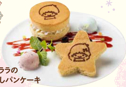
キキとララの なかよしパンケーキ ¥1,180(税抜)