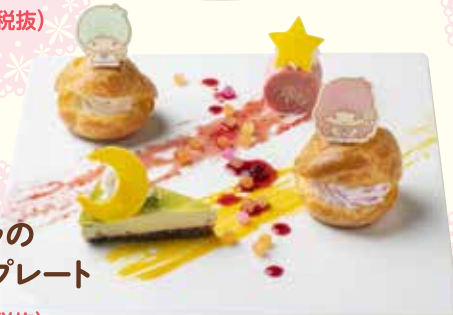
キキとララの デザートプレート ¥1,080(税抜)