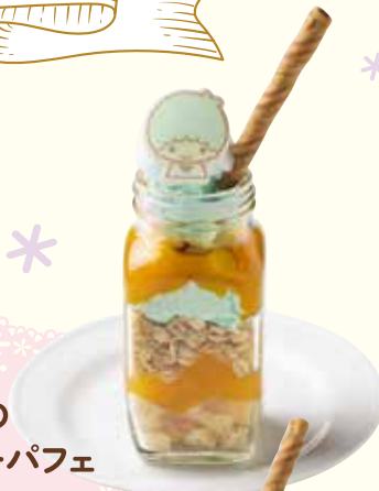
キキの ジャーパフェ ¥780(税抜)