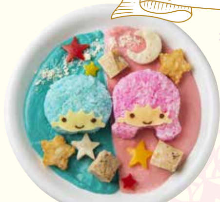
キキとララのツインカレー