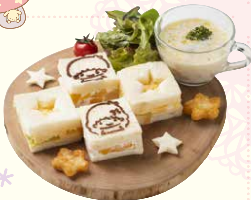
ララご自慢のスープとサンドウィッチ