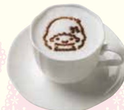
ララのカフェラテ ¥680(税抜)