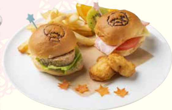
キキとララのツインバーガー